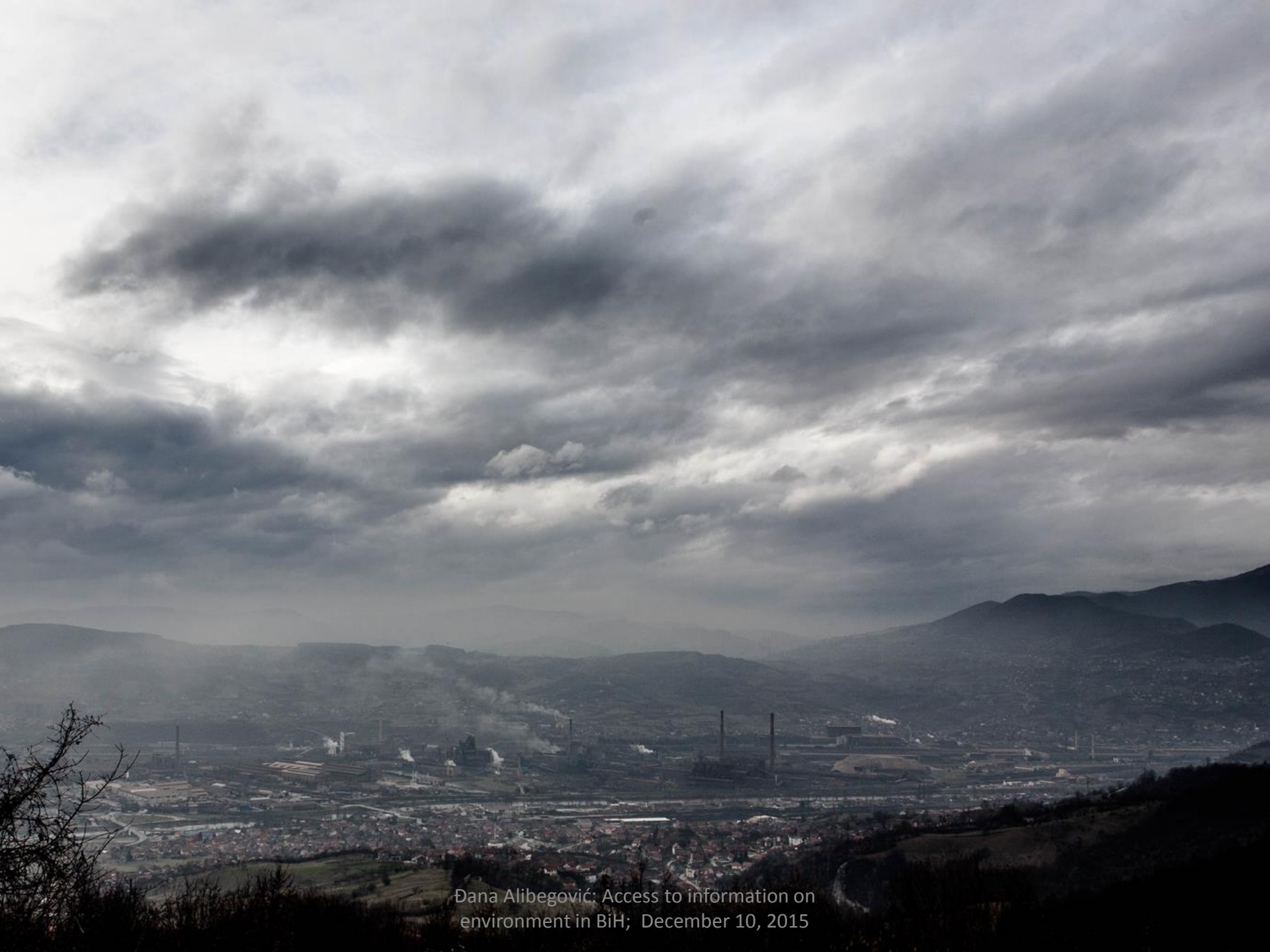
Dana Alibegović: Access to information on environment in BiH; December 10, 2015