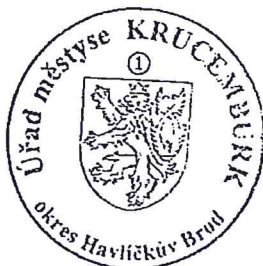
Mgr. Jiří Havlíček

Proti tomuto rozhodnutí je možno podat odvolání ke Krajskému úřadu kraje Vysočina – odbor životního prostředí podáním na Úřad městyse Krucemburk ve lhůtě 15 dnů ode dne doručení rozhodnutí.