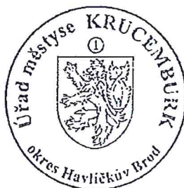
Mgr. Jiří Havlíček

Proti tomuto rozhodnutí je možno podat odvolání ke Krajskému úřadu kraje Vysočina – odbor životního prostředí podáním na Úřad městyse Krucemburk ve lhůtě 15 dnů ode dne doručení rozhodnutí.