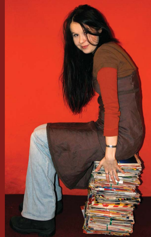
Docela slušný výběr. České domácnosti dostávají kolem 15 kg letáků ročně.