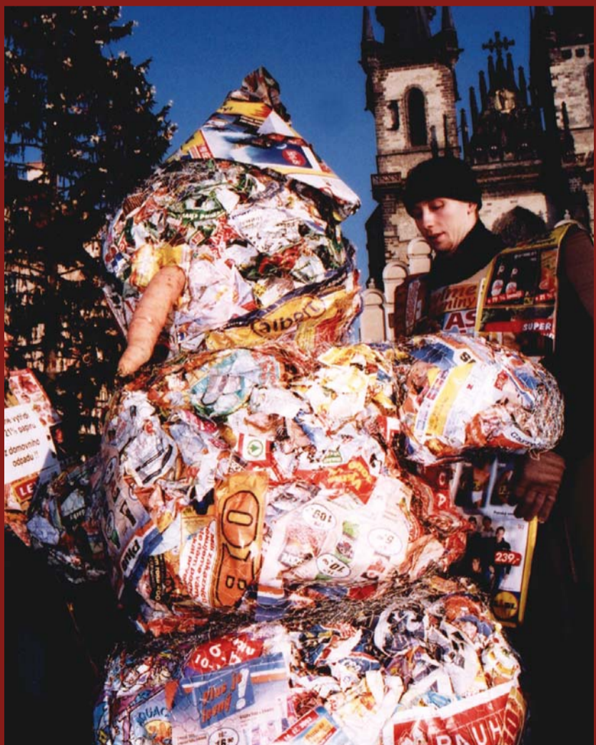
Pochod Prahou, upozorňující na nárůst reklamy v našich poštovních schránkách.

Výroba letáků zatěžuje životní prostředí, jejich životnost je krátká, část lidí je nečte a rovnou vyhazuje. Podle dlouholetého průzkumu s názvem „Češi a reklama“ se cítí letáky obtěžováno více než 60 % lidí. Účinnou obranou proti letákům je samolepka na schránce s nápisem „ Nevhazujte reklamu, prosím “. Většinou je respektována. Podle zákona o regulaci reklamy č. 40/1995 Sb. je nápis podmínkou, abychom si na obtěžování mohli stěžovat. Potom hrozí distributorovi pokuta až 2 milióny korun (od živnostenského úřadu).