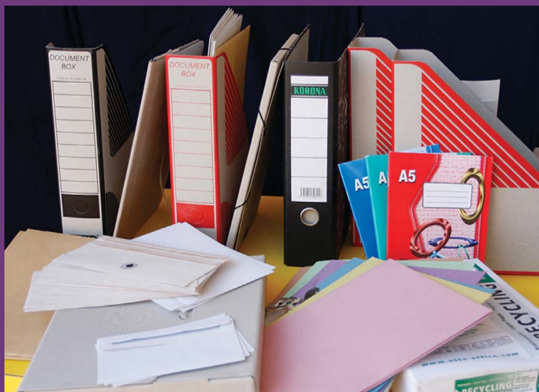
Různé kancelářské výrobky z recyklovaného papíru.

Grafické ztvárnění úspor při použití recyklovaného kancelářského papíru.