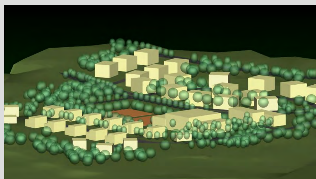
FUNKČNĚ REGULAČNÍ SITUACE 1:1000