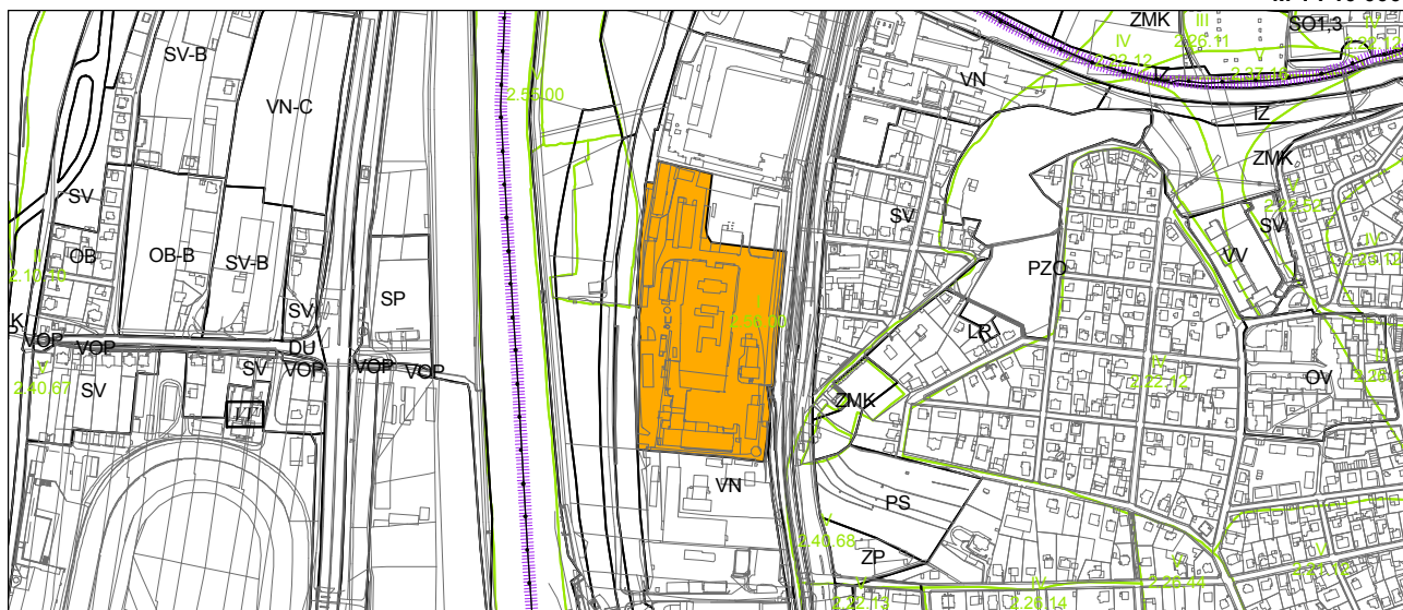
Zákras zadání změny schválený usnesením ZHMP č 35/06 ze dne 23.2.2006, s vyznačením hranic BPEJ