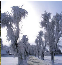
Alej dubů v Raduni