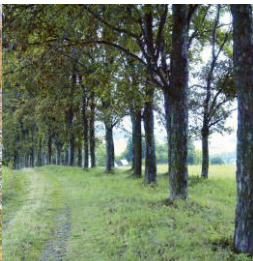
Alej památných lip na Uhlířském vrchu v Bruntále