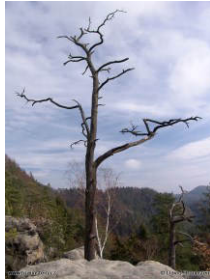
Zveřejněno systémem environmentálního řízení a auditu