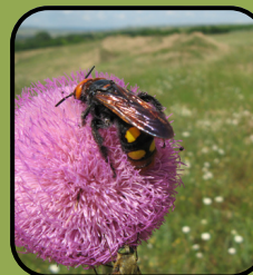
Megascolia maculata (Viespea gigant)