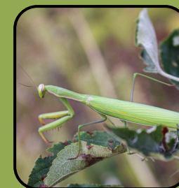
Mantis Religiosa (Călugărița)