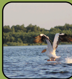
Pelecanus onocrotalus (Pelicanul comun)