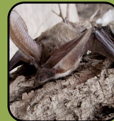
Plecotus auritus (Liliacul comun)