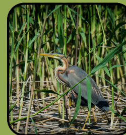
Ardea purpurea (Stârcul roșu)