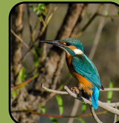
Alcedo atthis (Pescărașul albastru)