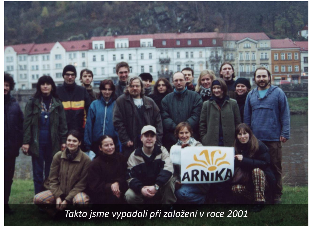
Takto jsme vypadali při založení v roce 2001