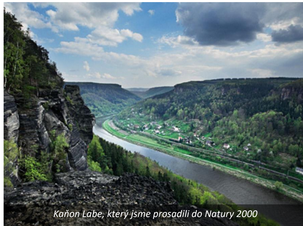
Kaňon Labe, který jsme prosadili do Natury 2000

Založili jsme Koalici nevládních organizací pro Naturu 2000, která dosáhla doplnění národního seznamu lokalit o více než 500 území (přes 30% celkového počtu), včetně dolního Labe, které bylo zpočátku vynecháno a později účelově zmenšeno z důvodu konfliktu se záměrem splavňování dolního Labe